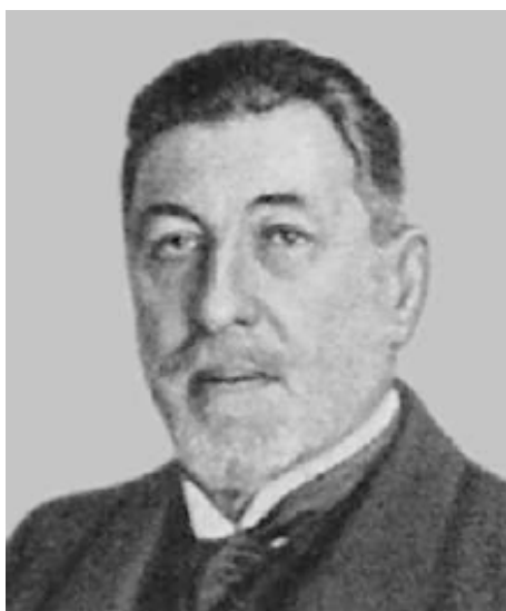
Dmitrij Nikolaevič Ovsjaniko-Kulikovskij (1853-1920)