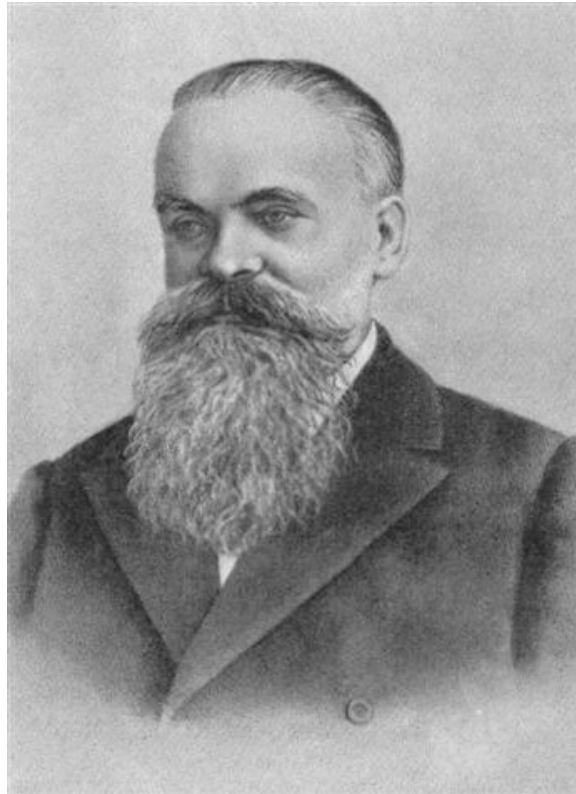
Filipp Fortunatov (1848-1914)