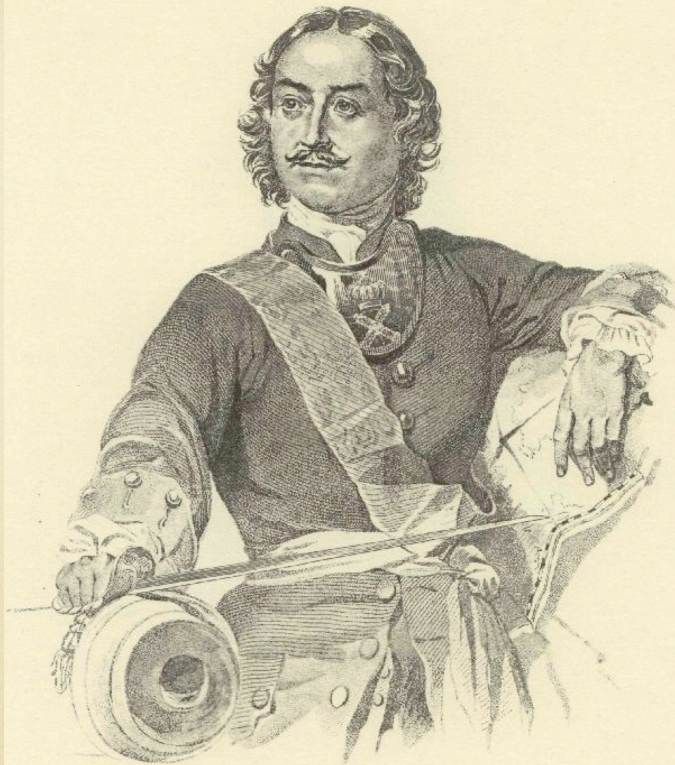
98. ПОРТРЕТ ПЕТРА I. Гравюра. [1844].