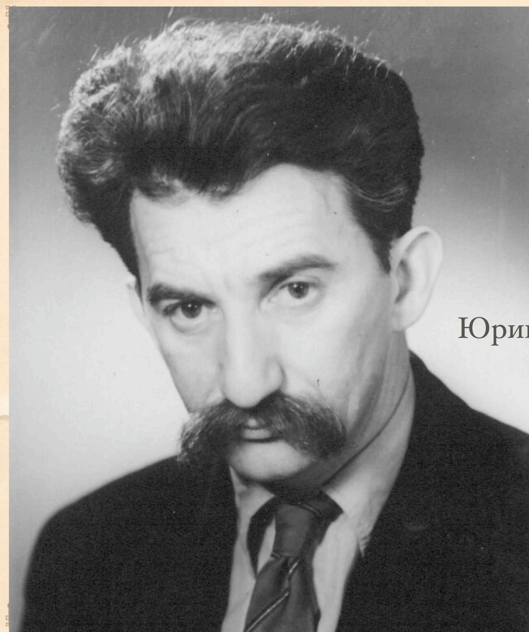
Юрий Михайлович Лотман 1922-1993