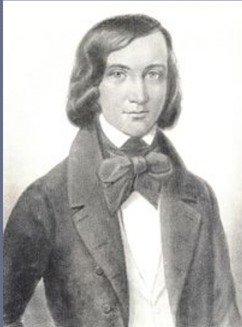
Nicolai Vladimirovich Stankevitch (1813-1840)